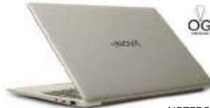
NOTEBOOK ENOVA 6 CTAS. DE $ 82.331