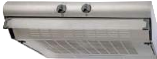
Purificador AX800A Acero AXEL