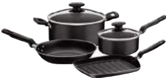
Bateria De Cocina 40 Piezas. TRAMONTINA