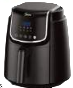
Freidora sin aceite, 4lts. Control Digital. MIDEA

CONSULTE PRECIOS, STOCK SUJETO A MODIFICACION