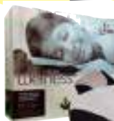
COJIN MASAJEADOR SHIATSU DUO GA.MA 9 CTAS. DE $ 33.190

RELOJES TRESSA ORIENT - SEIKO - CASIO LORUS - KVN