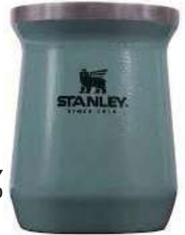
Mate STANLEY 3 CTAS. DE $ 22.260