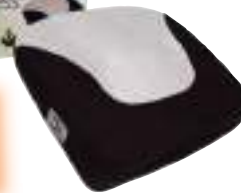
PICADORA 1,2,3 MOULINEX 6 CTAS. DE $ 15.761

CONSULTE PRECIOS - STOCK SUJETO A MODIFICACION