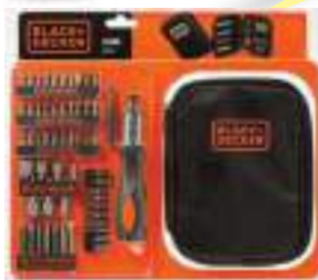
ATORNILLADOR MANUAL + 56 PUNTAS BLACK + DECKER 9 CTAS. DE $ 9.332

Gran variedad de productos al MEJOR PRECIO FINANCIACIÓN HASTA EN 12 CUOTAS