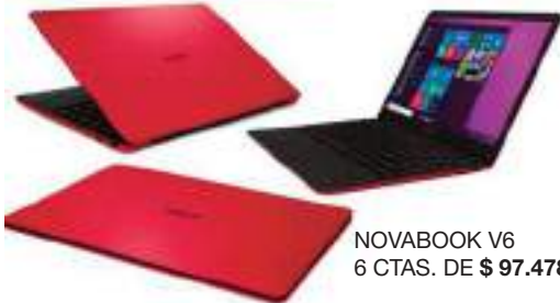
NOVABOOK V6 6 CTAS. DE $ 97.478