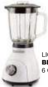
LICUADORA BLACK + DECKER 6 CTAS. DE $ 20.995

Relojería - Joyería - Artículos para el Hogar - Audio y Video - Cuidado Personal del Hombre y la Mujer - Herramientas B&D, DEWALT, STANLEY, etc.