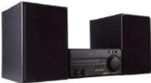
MINICOMPONENTE SMARTLIFE SL-HF100 - BLUETOOTH 12 CTAS. DE $ 61.335