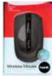
MOUSE INALAMBRICO HAVIT 3 ctas. de $ 5.139