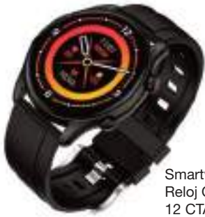
Smartwatch Reloj Quantum Q5 X-VIEW 12 CTAS. DE $ 13.785