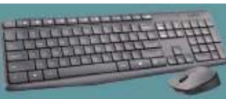
TECLADO Y MOUSE LOGITECH. 12 ctas. de $ 11.491