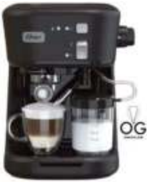
CAFETERA ESPRESSO Y CAPUCCINO OSTER 12 CTAS. DE $ 44.400