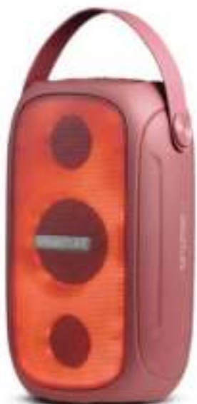
PARLANTE SMARTLIFE 55W. 12 CTAS. DE $ 40.635

Gran variedad de productos al MEJOR PRECIO FINANCIACIÓN HASTA EN 12 CUOTAS