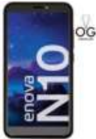
CELULAR ENOVA N10- 64GB. 2GB RAM 6 CTAS. DE $ 26.960