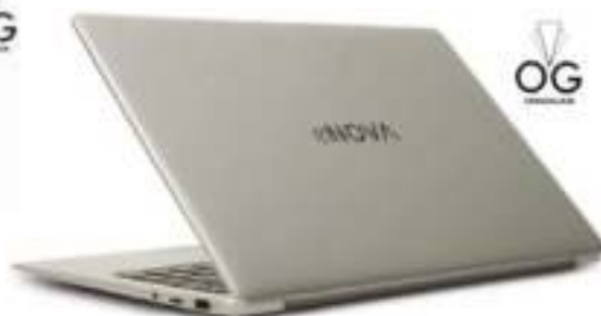
NOTEBOOK ENOVA 14 (Pantalla: 14" 4 GB. - SSD: 128 GB Procesador: Intel Celeron 4020) 12 CTAS. DE $ 50.665

CONSULTE PRECIOS - STOCK SUJETO A MODIFICACION