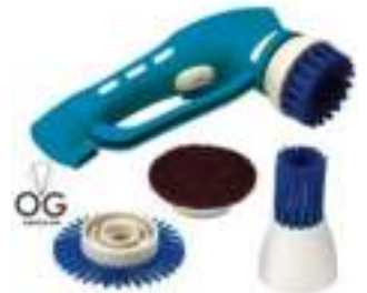
LIMPIADOR ELÉCTRICO MULTIUSO SMART TEK 6 CTAS. DE $ 13.590