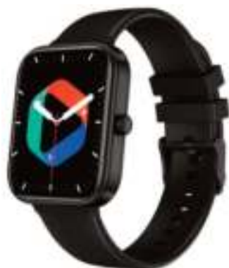
RELOJ SMART WATCH Q 1S X-VIEW 9 CTAS. DE $ 7.235