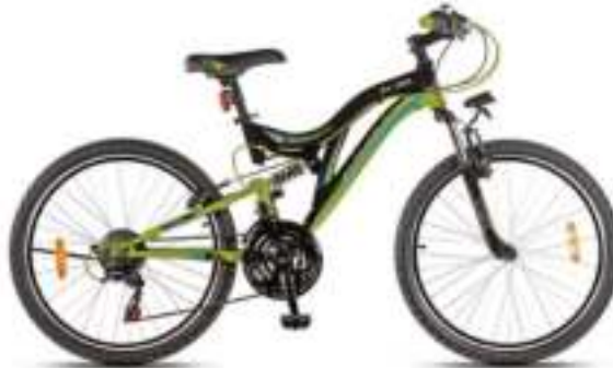
Bici DSX20 Rod.20 AURORA