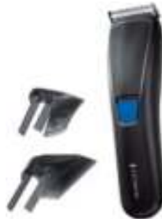
CORTADORA DE PELO REMINGTON 12 CTAS. DE $ 5.320