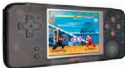
CONSOLA PORTABLE RETRO BOY X PRO 12 CTAS. DE $ 11.987