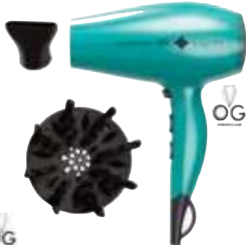
SECADOR DE PELO GA.MA 12 CTAS. DE $ 12.515