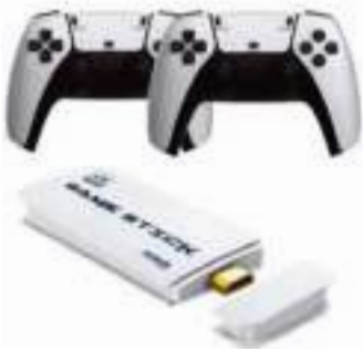
Consola Retro M15 64GB THE KING