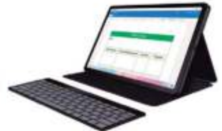
Tablet NXTPAPER11 128 GB. TCL