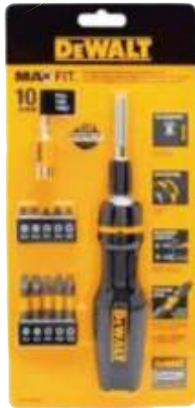
DESTORNILLADOR MANUAL TELESCÓPICO DEWALT 3 CTAS. DE $ 12.680