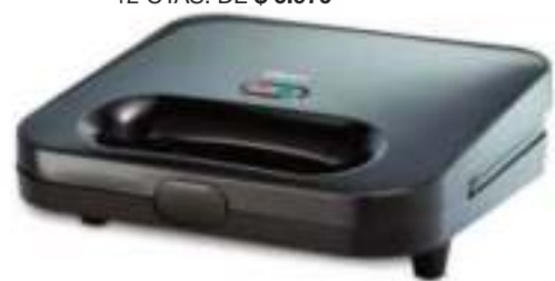
SANDWICHERA OSTER 12 CTAS. DE $ 6.970

CONSULTE PRECIOS - STOCK SUJETO A MODIFICACION