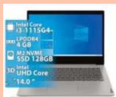
NOTEBOOK LENOVO 3 14ITL05 INTEL I3-1115G4 4GB 128GB 1920X1080 14 PULGADAS WIN11 Y TECLADO EN INGLES GRIS