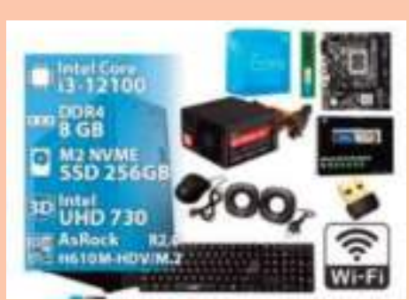
CPU SENTEY INTEL I3-12100 4.3GHZ 8GB 256GB NVME WIFI VGA HDMI DP OFICINA INTERNET CON TECLADO MOUSE PARLANTES