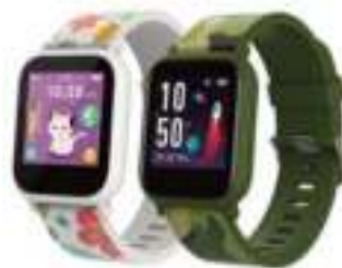
SMART WATCH KIDS CRONOS 12 CTAS. DE $ 5.320

CONSULTE PRECIOS - STOCK SUJETO A MODIFICACION