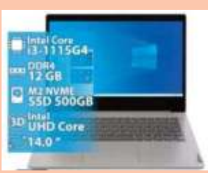
NOTEBOOK LENOVO 3 14ITL05 INTEL I3-1115G4 12GB 500GB NVME 1920X1080 14 PULGADAS WIN10 Y TECLADO EN INGLES GRIS