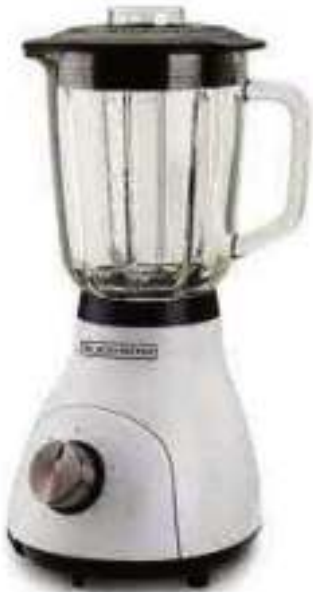
LICUADORA BLACK+DECKER 3 CTAS. DE $ 53.810

Gran variedad de productos al MEJOR PRECIO FINANCIACIÓN HASTA EN 12 CUOTAS