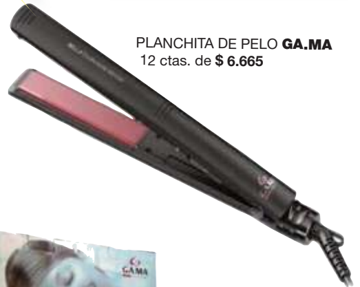
PLANCHITA DE PELO GA.MA 12 ctas. de $ 6.665