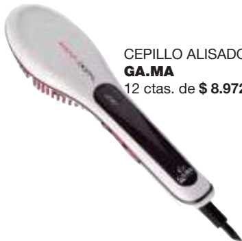
CEPILLO ALISADOR GA.MA 12 ctas. de $ 8.972