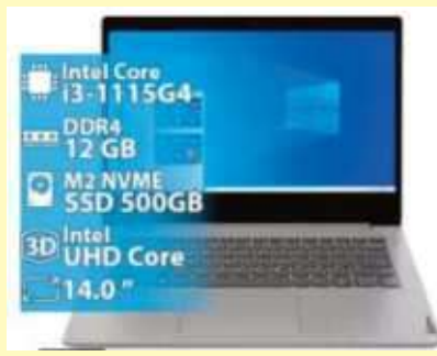
NOTEBOOK LENOVO 3 14ITL05 INTEL I3-1115G4 12GB 500GB NVME 1920X1080 14 PULGADAS WIN10 Y TECLADO EN INGLES GRIS