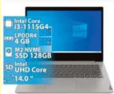
NOTEBOOK LENOVO 3 14ITL05 INTEL I3-1115G4 4GB 128GB 1920X1080 14 PULGADAS WIN11 Y TECLADO EN INGLES GRIS