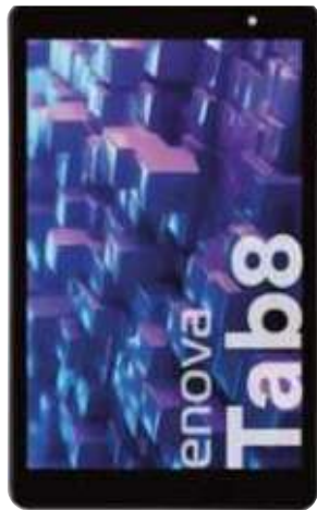
TABLET TAB.8 32 GB. ENOVA 9 ctas. de $ 19.010