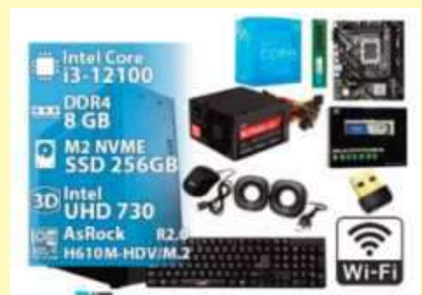
CPU SENTEY INTEL I3-12100 4.3GHZ 8GB 256GB NVME WIFI VGA HDMI DP OFICINA INTERNET CON TECLADO MOUSE PARLANTE