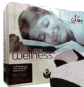
ALMOHADILLA MASAJEADORA SHIATSU DUO GA.MA 9 ctas. de $ 31.250

CONSULTE PRECIOS - STOCK SUJETO A MODIFICACION