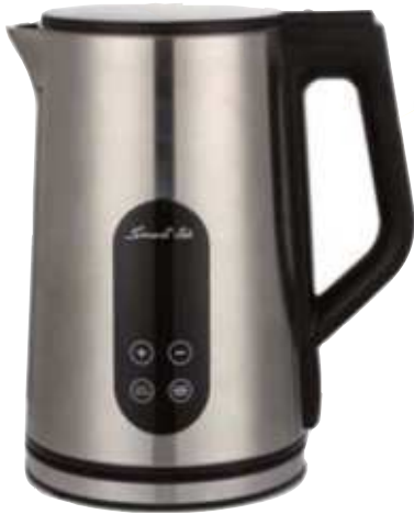
JARRA ELECTRICA SMART-TEK 12 ctas. de $ 11.320

Gran variedad de productos al MEJOR PRECIO FINANCIACIÓN HASTA EN 12 CUOTAS