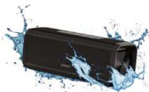
PARLANTE SMARTLIFE 14 W. 3 CTAS. DE $ 25.400