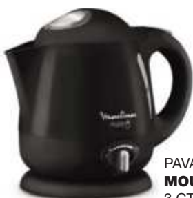
PAVA ELECTRICA MOULINEX 3 CTAS. DE $ 23.260