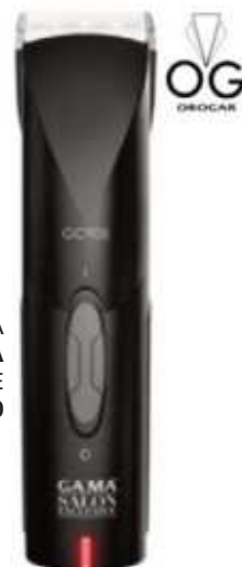
CORTADORA DE CABELLO GAMA SALON EXCLUSIVE 6 CTAS. DE $ 12.080