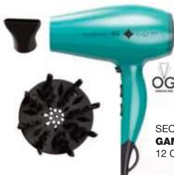
SECADOR DE PELO GAMA KERA SHINE 12 CTAS. DE $ 11.107