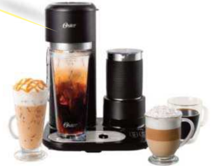
CAFETERA OSTER LATTE-COFFEEMAKER 4 EN 1 12 ctas. de $ 23.667