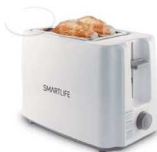
TOSTADORA SMARTLIFE 6 ctas. de $ 8.671