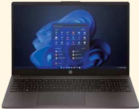
Notebook HP 250 G10 i3-1315U 15 8GB/256 PRECIO CONTADO $ 815.000