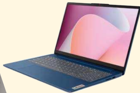
Notebook Lenovo IP Slim 3 15AMN8 15.6" FHD AMD R3 7320U 8GB DDR5 5500 256G NVME W11H PRECIO CONTADO $ 830.000