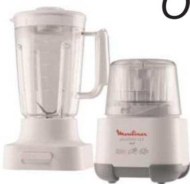
PICADORA 1.2.3 Y LICUADORA MOULINEX 3 ctas. de $ 42.314