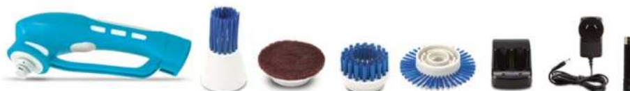
CEPILLO ELECTRICO INALAMBRICO SMART TEK 12 ctas. de $ 7.779