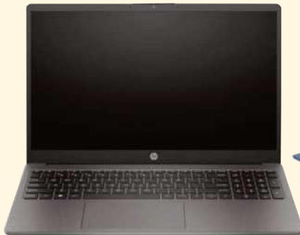
Notebook HP 255 G10 R3-7330U 15 8GB/256 PRECIO CONTADO $ 765.000