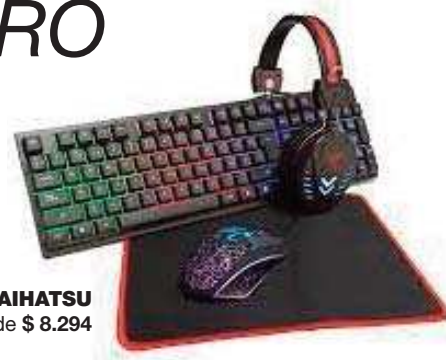
SET GAMER DAIHATSU 9 ctas. de $ 8.294