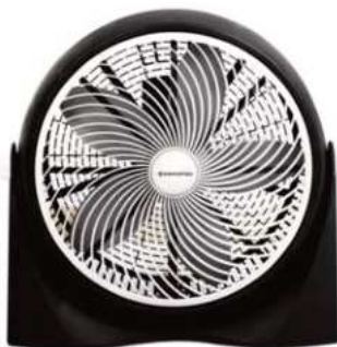
TURBO DAIHATSU 20" 12 ctas. de $ 7.088

CONSULTE PRECIOS - STOCK SUJETO A MODIFICACION