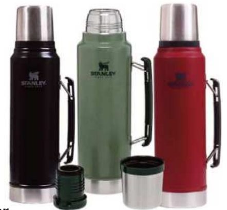
TERMO CLASSIC STANLEY 1 LITRO 3 ctas. de $ 43.594