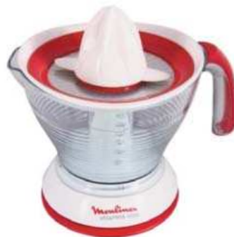
EXPRIMIDOR MOULINEX 3 ctas. de $ 15.658