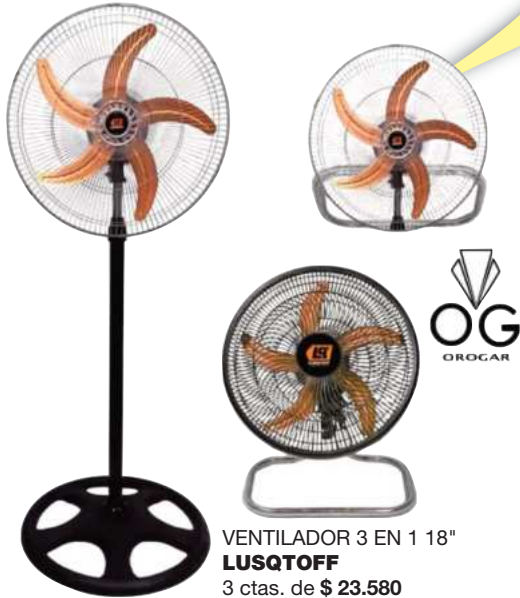
VENTILADOR 3 EN 1 18" LUSQTOFF 3 ctas. de $ 23.580

Gran variedad de productos al MEJOR PRECIO FINANCIACIÓN HASTA EN 12 CUOTAS